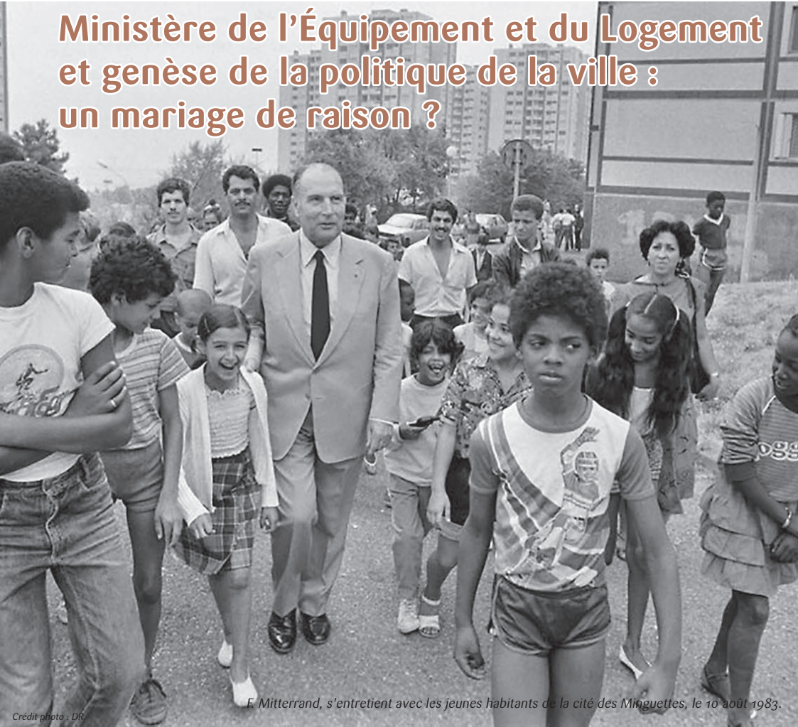
F. Mitterrand, s'entretient avec les jeunes habitants de la cité des Minguettes, le 10 août 1983.